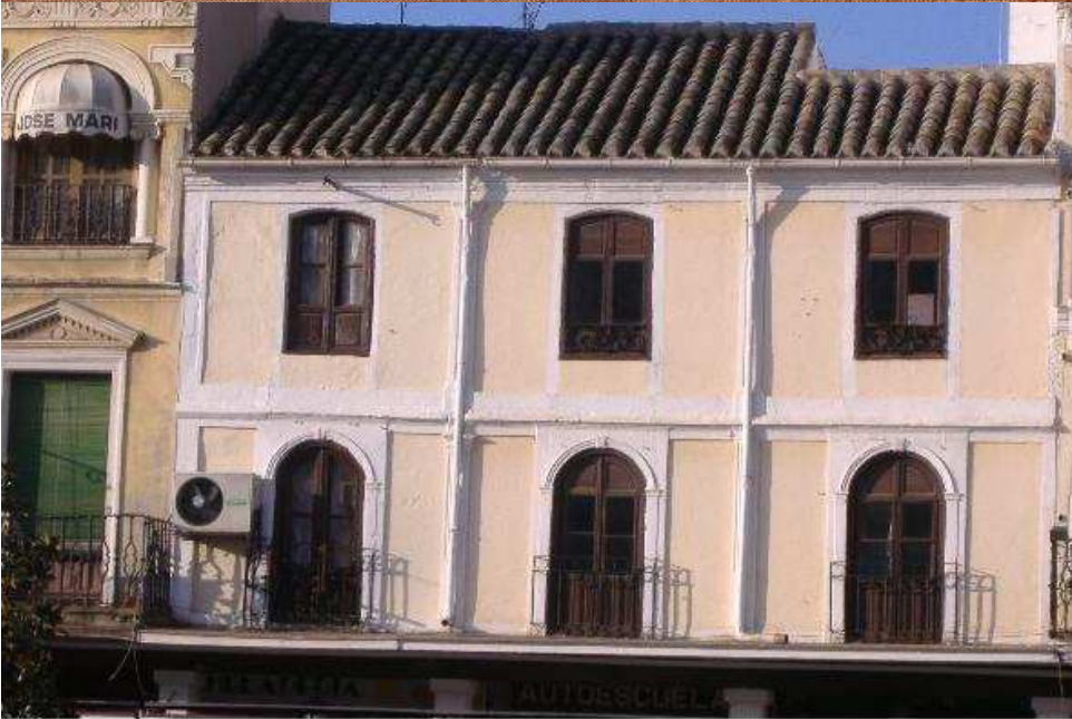
CASA MEDIEVAL EN LA PLAZA MAYOR