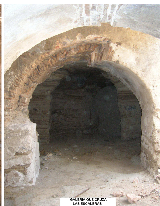
GALERIA QUE CRUZA LAS ESCALERAS