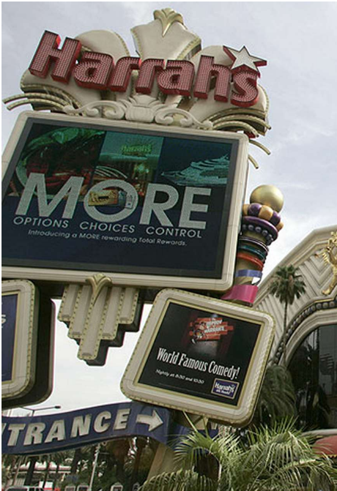
Un casino del Grupo Harrah's en la localidad estadounidense de Las Vegas.

jugadores de Italia, Austria y Alemania. Además, la firma quiere construir un casino en el estadio de Wembley, en Londres. Los promotores estadounidenses, con su aterrizaje en La Mancha, han buscado una ciudad que no se halle excesivamente lejos de Madrid y que cuente con unas infraestructuras de transporte adecuadas para los próximos años.