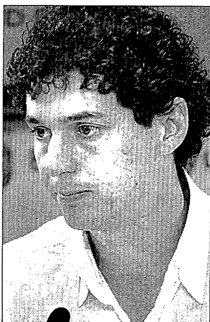
César Manrique, Festejos

Pero el partido que se ha visto diezmado ha sido el PP y esa nueva minoría plenaria tendrá reflejo en las comisiones aunque amortiguada. El organigrama actual del Ayuntamiento lo forman tres grandes comisiones que se reparten todas las concejalías bajo los epígrafes más generales de Gobernación, Urbanis-