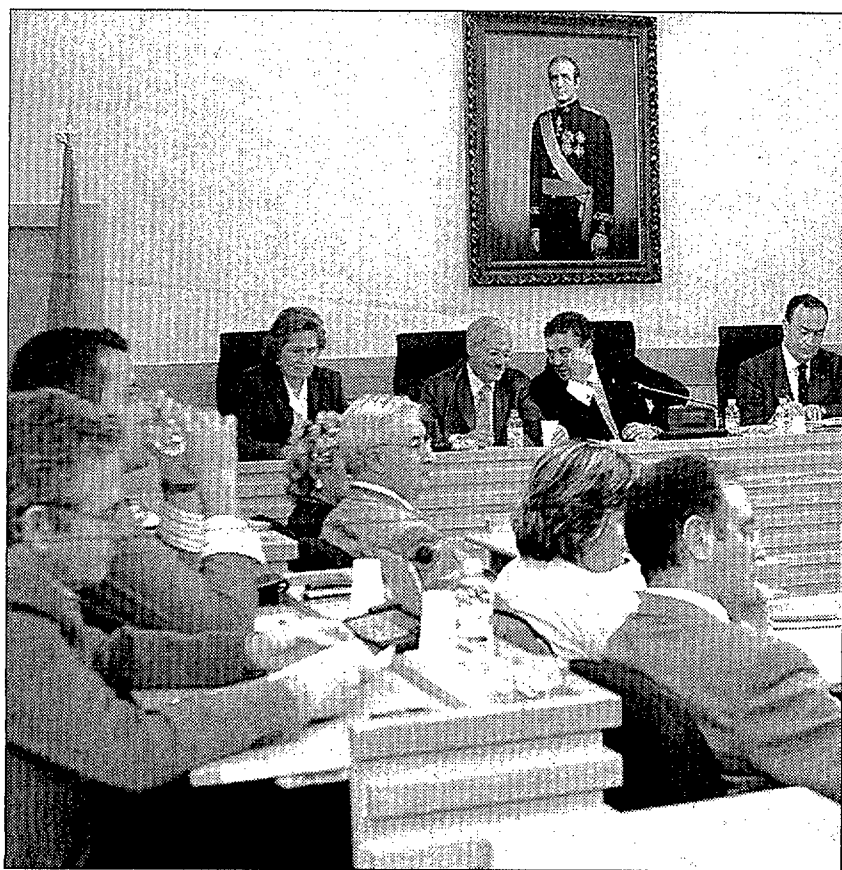
Imagen de archivo de una sesión plenaria